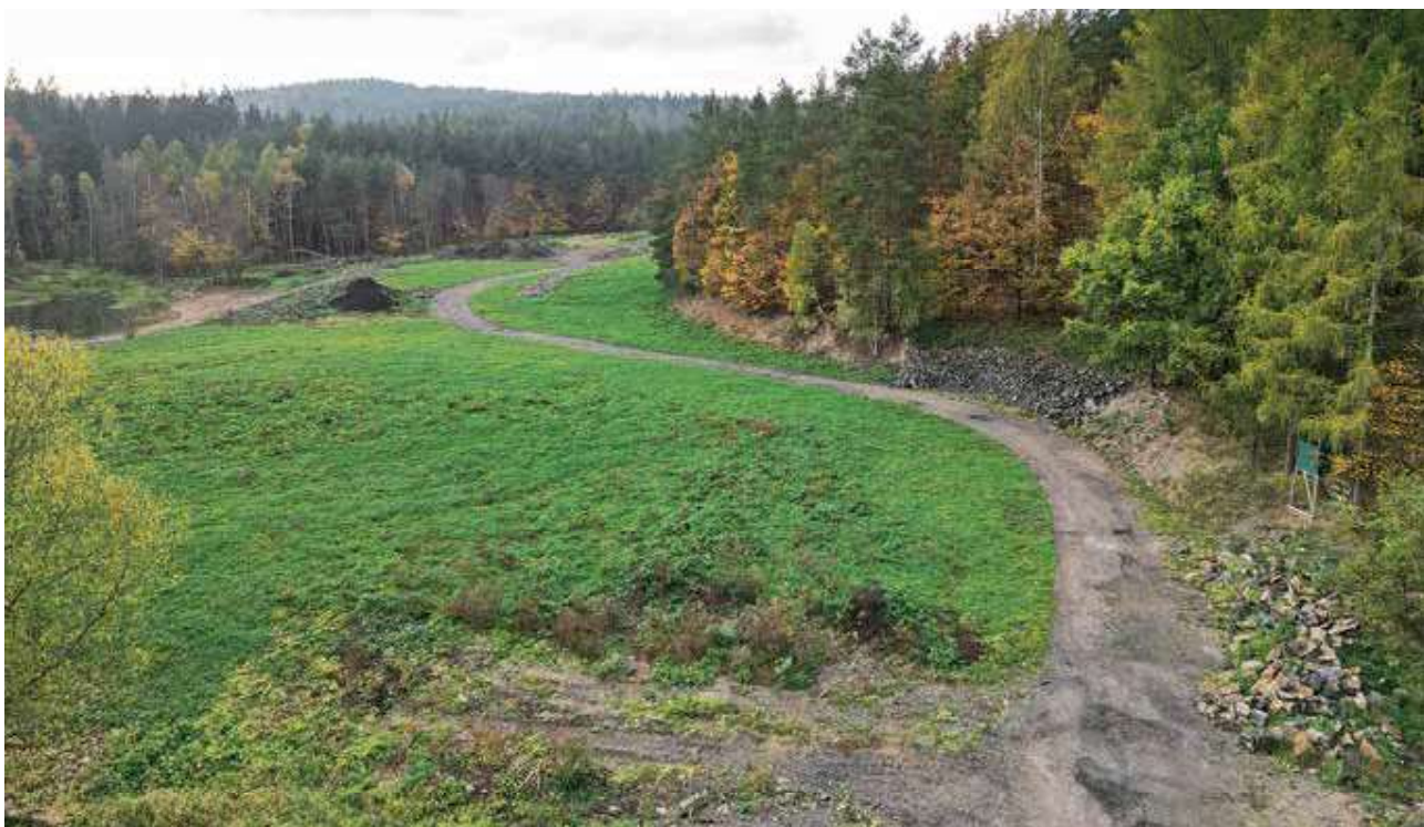
Uprostřed křivoklátských lesů se donedávna nacházela chátrající výrobní dřevěného uhlí. Lesy ČR budovy odkoupily a společně se správou CHKO zde provedly rekultivaci území, včetně realizace objektů pro zadržování vody v krajině.

Jedná se o oblast, která byla lidskou činností od pradávna ovlivňována, a současná podoba lesa s vysokým podílem přirozené dřevinné skladby je výsledkem profesionální práce lesníků několika generací. V současné době se v lesnictví jako celku klade důraz na zvyšování podílu listnáčů v nižších a středních polohách. Za několik desítek let proto lesy podobné křivoklátským porostou na daleko větším území a nikoho nenapadne tam kvůli tomu vyhlášovat NP. Pokud přihlédneme k těmto aspektům a znění zákona o ochraně přírody a krajiny, území splňuje stávající zařazení do CHKO a význačné lokality jsou dostatečně chráněny formou maloplošných chráněných území.