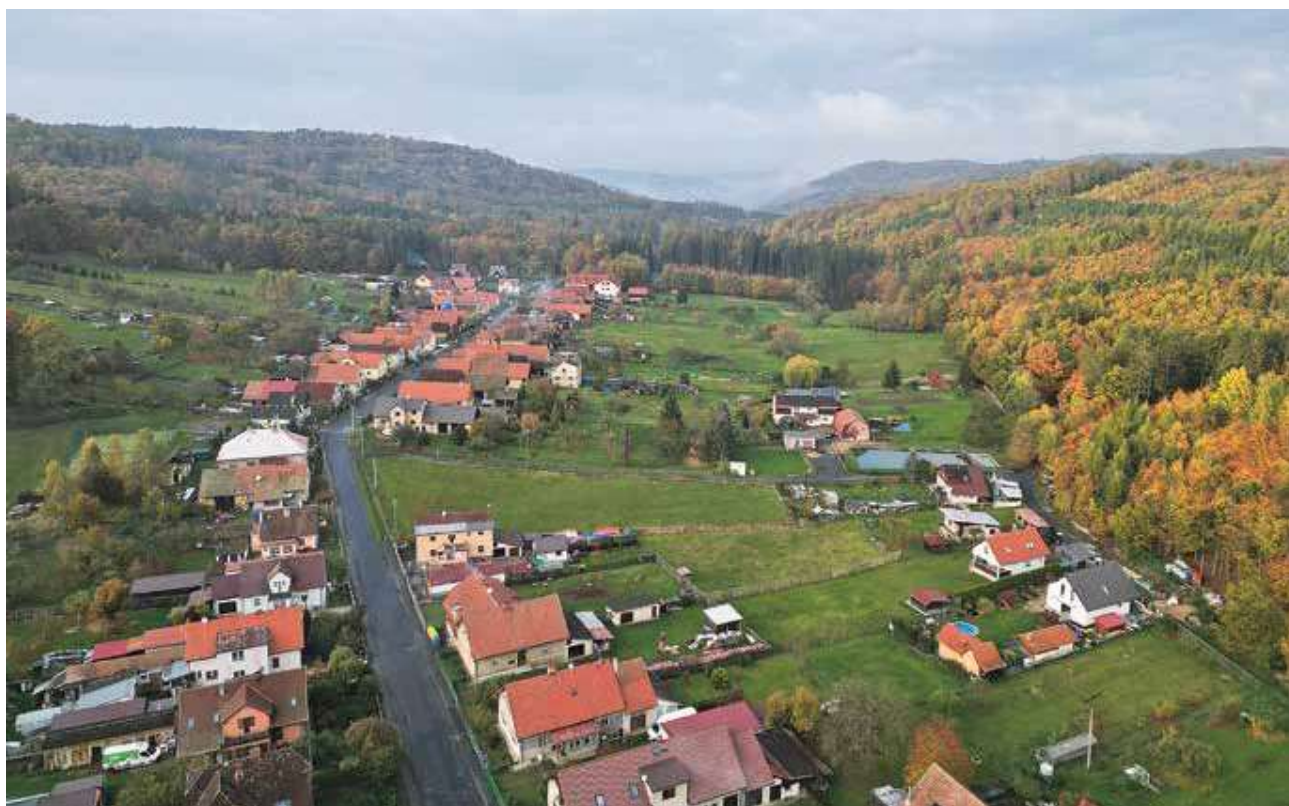
Obec Karlova Ves, která se dle návrhu vymezení území nachází jako jediná uvnitř národního parku.