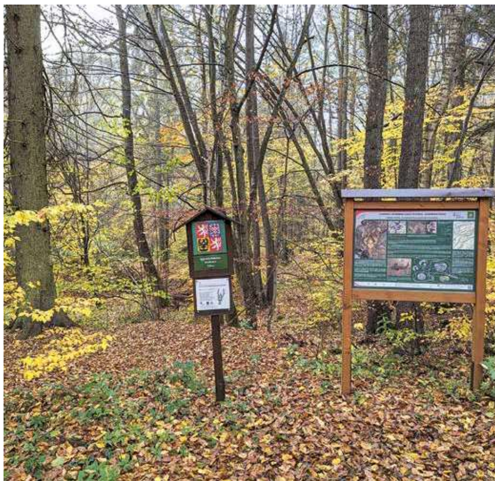
Národní přírodní rezervace Týřov, CHKO Křivoklátsko.

Plocha zóny soustředěné péče o přírodu se dělí podle dlouhodobých cílů na dvě části. V jedné části této zóny je dlouhodobým cílem podpora přirozených procesů. V této části zóny soustředěné péče o přírodu je přednostním cílem ochrany zvyšování stupně přirozenosti porostů