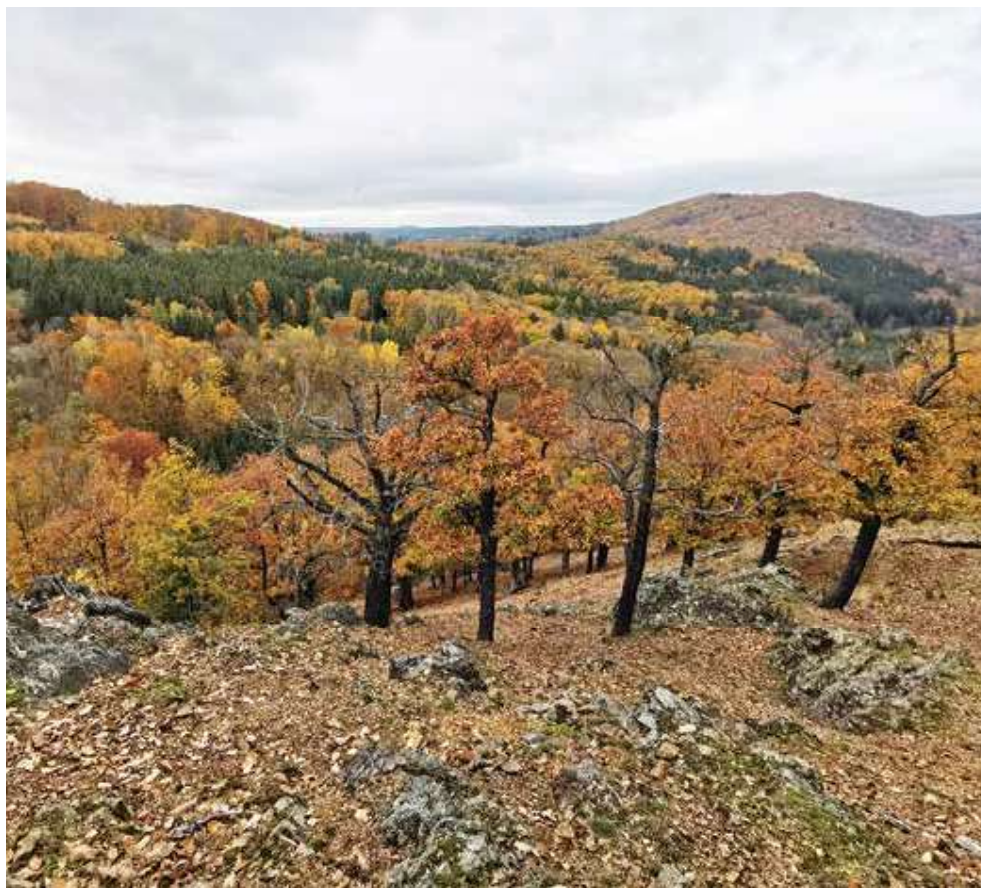
Polesí Vlastec na Křivoklátsku, majetek Colloredo-Mannsfeld.

■ Lesní závod by nevznikal přes odpor obcí a obyvatel Křivoklátska. Podpora místního obyvatelstva je nutná pro úspěch celého záměru.