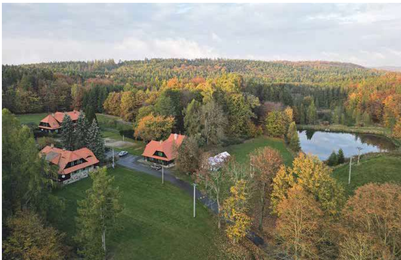
Uvnitř plánovaného území národního parku se nacházejí obývané a využívané objekty. Příkladem je hájovna Emilovna, která by se vznikem národního parku pravděpodobně přešla do užívání Správy NP.