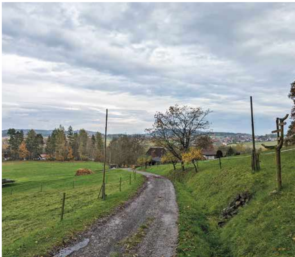
Venkovská krajina Křivoklátska (Broumy).

předseda petičního výboru petice Nesouhlas se zřízením Národního parku Křivoklátsko, zakladatel iniciativy Otevřené Křivoklátsko