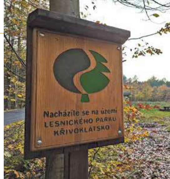
Lesnický park byl na Křivoklátsku vyhlášen v květnu 2010 s heslem „Území pro přírodu i pro lidi“.

Pokud budu něco považovat za krátkodobý přínos, a podtrhuji slovo krátkodobý,