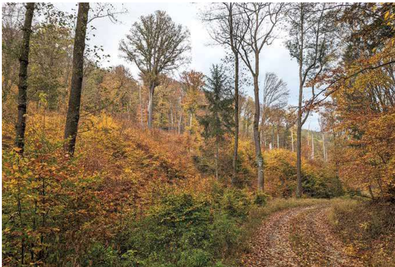
Ševcova cesta v sousedství NPR Týřov.

stoupající návštěvnost na turisticky přístupných místech (kde většinou vede naučná nebo turistická stezka) a nepatrně klesající návštěvnost na místech, kam je již dnes vstup veřejnosti ze zákona zakázán. Výjimkou bylo jen několik měsíců roku 2020, kdy pandemie covidu-19 vyhnala lidi do lesů. Sběr dat jsme zahájili v roce 2008 právě proto, abychom měli představu, jak se bude návštěvnost vyvíjet v případě vyhlášení NP, a mohli včas reagovat. Osobně se „overturismu“ neobávám. Na Křivoklátsku nemáme Pravčickou bránu ani Sněžku. Předcházet nadměrné turistické zátěži území jde vytvářením vhodné a limitované infrastruktury pro návštěvníky a jejich cíleným usměrňováním tam, kde nemohou škodit. Morfologie terénu, absence návštěvnícky lákavých lokalit, nedostatek turistické infrastruktury a nepřístupnost centrální části Křivoklátska – to jsou samo o sobě argumenty, že bude území i do budoucna chráněno před enormní turistickou zátěží. Národní park s navazující CHKO ochranu území v tomto směru může jen umocnit.