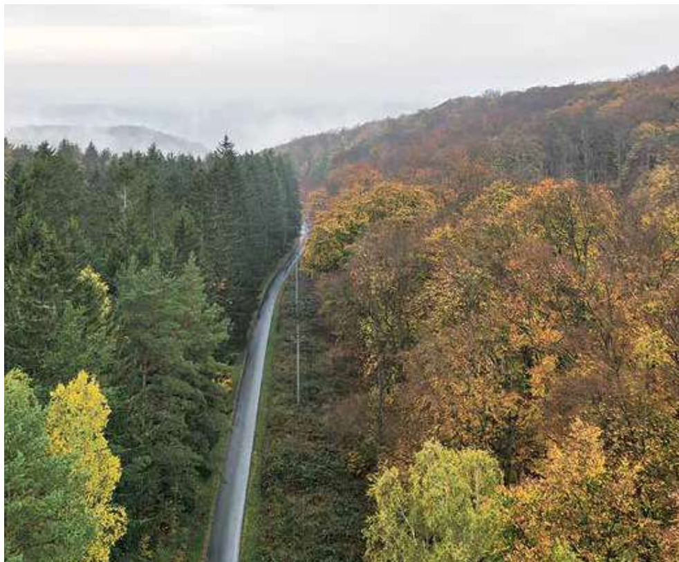
Pestrá druhová skladba a poměrně hustá lesní cestní síť Křivoklátska.

Je to jeden z řady negativních dopadů vzniku NP, který se relativizuje a bagatelizuje. Skutečnost je taková, že na dotčeném území je přes 1 000 km účelových lesních komunikací, které vlastníci a správci lesa na své náklady pravidelně udržují mimo jiné i kvůli průjezdnosti složek integrovaného záchranného systému. Stávající síť značených cyklotras je v dotčeném území pouze 47 km, z toho však po lesních cestách vede jen 8 km, ostatní vedou po veřejných komunikacích. Cyklisté by nejspíše byli nuceni zapomenout na bezstarostné toulky po křivoklátských lesních cestách.