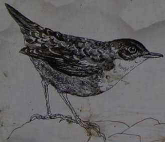
Skorec vodní ( Cinclus cinclus )