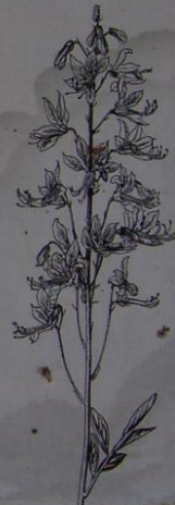
Tremáčka bílá ( Dactamnus albus )

NPR Vůznice náleží společně s rezervacemi Týřov, Velká Píed a Křehoutův mezi nejmenší částí chráněné krajiny oblastí Křivoklátsko a celostátní i mezinárodní význam těchto území je důvodem jejich nepřetržitě ochrany podle zákona o ochraně přírody a krajiny v kategorii národní přírodní rezervace. Kromě několika chráněných druhů rostlin jsou zde především zachována lesní sepeleňstva s přirovnáním duhovým sídlením lesního pásu, například tepelně doubravy s mochnou bílou, někdyk typů svahových sůlových leš, habrové doubravy, křepál a zárně doubravy a ve zbytku i relativní bory. Heleší vegetace je zastoupena sepiomými sepeleňstvy na skalních výstřepích. Celkem bylo v území nalezeno 459 druhů rostlin, 14 z nich je v seznamu chráněných druhů, například měsáček vytrvalý, lille zlatohlavá, Memová bílá, tis a další.