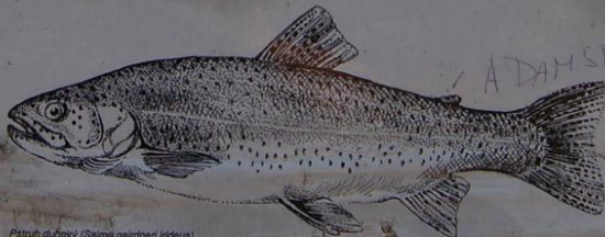
Pstruh duhový ( Salmo gairdneri ideus )