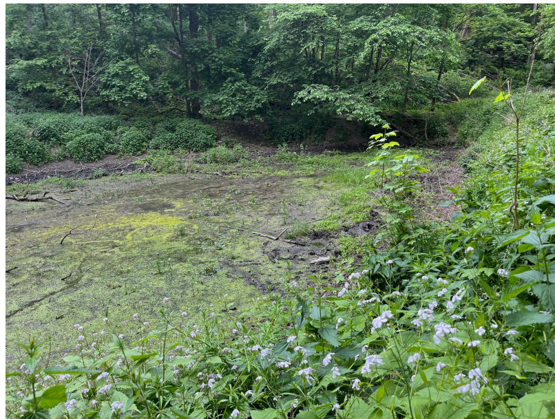
5. květen - přebagrovaný přítok