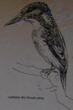
Lechtáček říční ( Alcedo atthis )