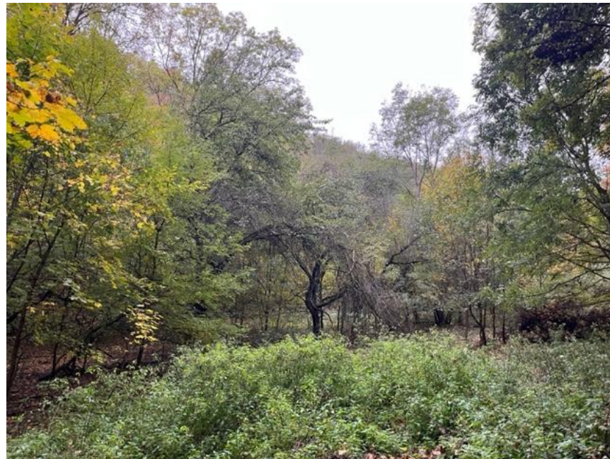
Zpustlý vysokokmenný ovocný sad v dolní části rezervace. Staré odrůdy ovocných stromů na louce tu postupně pohlcuje nálet, tráva se změnila ve všudypřítomné kopřivy.