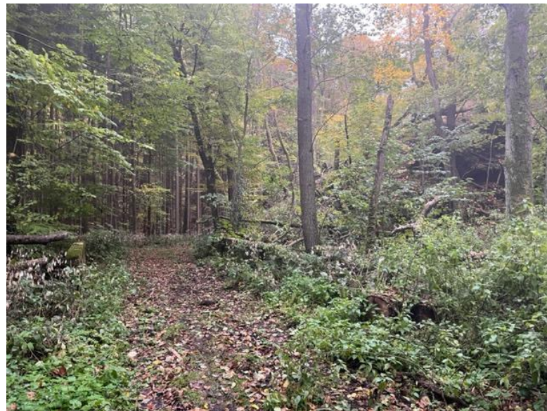
Stejné místo na podzim 2023.