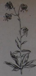
Lille zlatohlavá ( Lilium martagon )