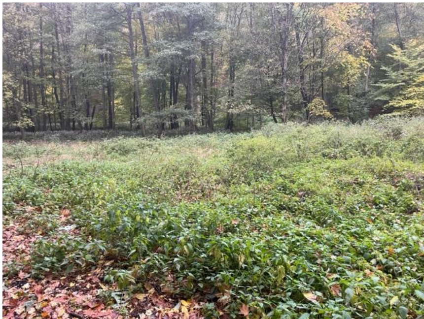
Nesečená louka v horní části rezervace - traviny a luční květy změněné díky podmáčení na porost z kopřiv.