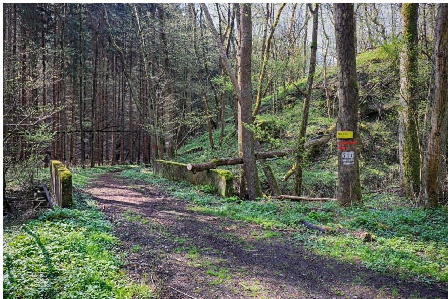
Traumatologický bod BE 012 v létě 2019.