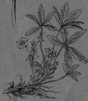
Mochna bílá ( Potentilla alba )