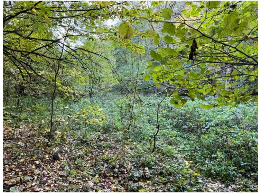
Zarůstání luk nálety dřevin a kopřivami.