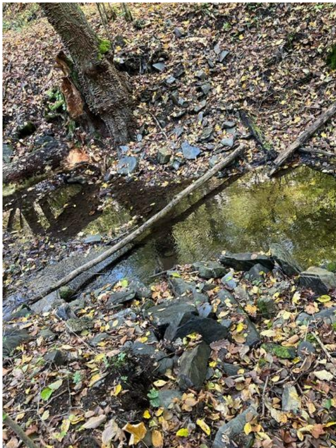
Hrázka na potoce zbouraná v roce 2021. Byla to jedna z posledních tůní v potoce.