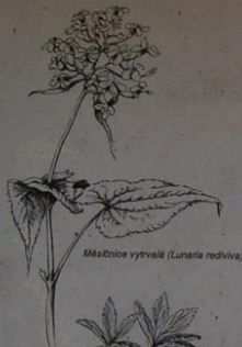
Mésenice vytrvalá ( Lunaria rediviva )