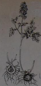
Dymnivka dutá ( Corydalis cava )