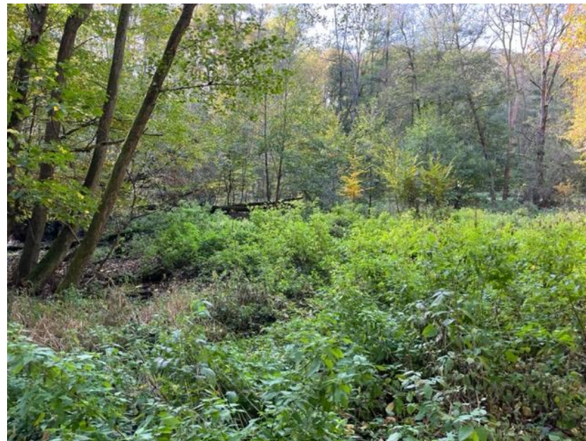
Sádky Baterie - zlikvidovaná vodní plocha, ze které zbyla jenom podmáčená půda s výskytem kopřiv.