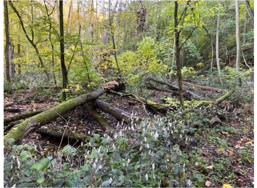
Hromadění spadaného dřeva v NPR Vůznice.