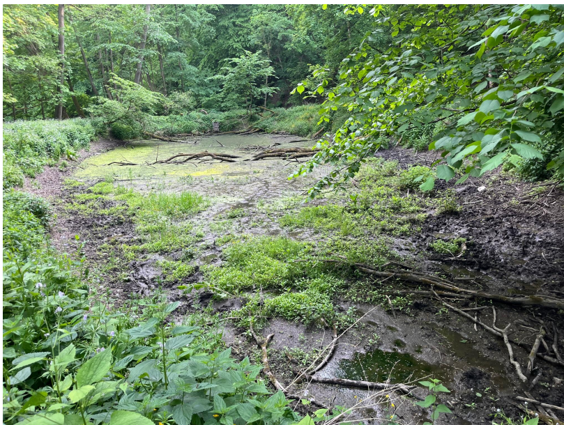
Vše co zbylo z rybníku 5. květen